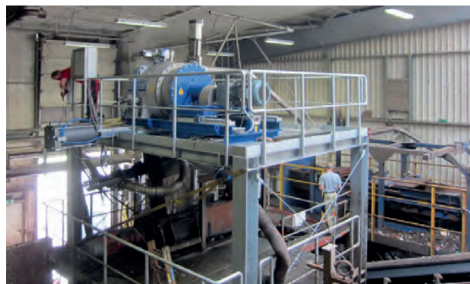
das neu entwickelte Aggregat, das in Süddeutschland steht

Die erste Anlage wurde 2016 nach Süddeutschland geliefert und ist dort erfolgreich im Einsatz. Erste Ansätze gab es bereits vor acht Jahren, als ein Rejector für Restaurant-Abfälle nach Frankreich geliefert wurde. „Unser Team kann sich eine erfolgreiche Entwicklungsarbeit ins Stammbuch schreiben und es wurde ein nicht unbedeutender Beitrag für den Umweltschutz geleistet“, so die beiden Geschäfts-