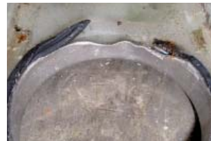
Verschleiß durch Rotation