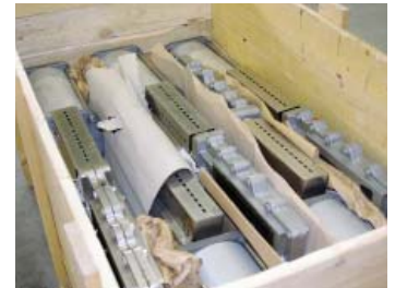
neuwertiger reparierter Schieber