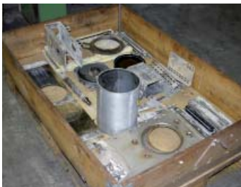
Demontage und Befundbericht